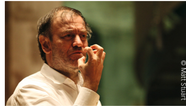
Valery Gergiev conductor

Übersetzung aus dem Englischen: Elke Hockings